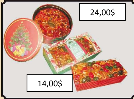
Gâteau Fleur des neiges 800 gr.