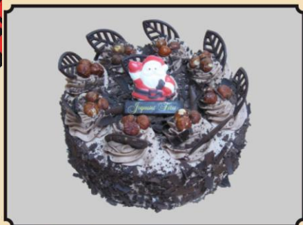
Moka Choco-Noisettes 800 gr.