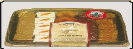
25 bouchées assorties