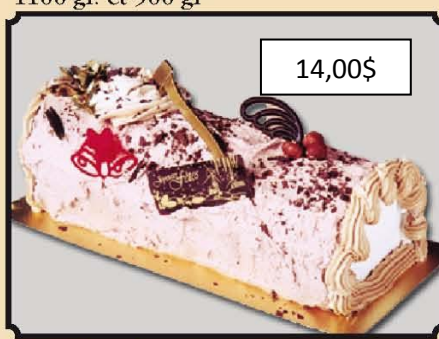
Bûche érablé 650 gr.